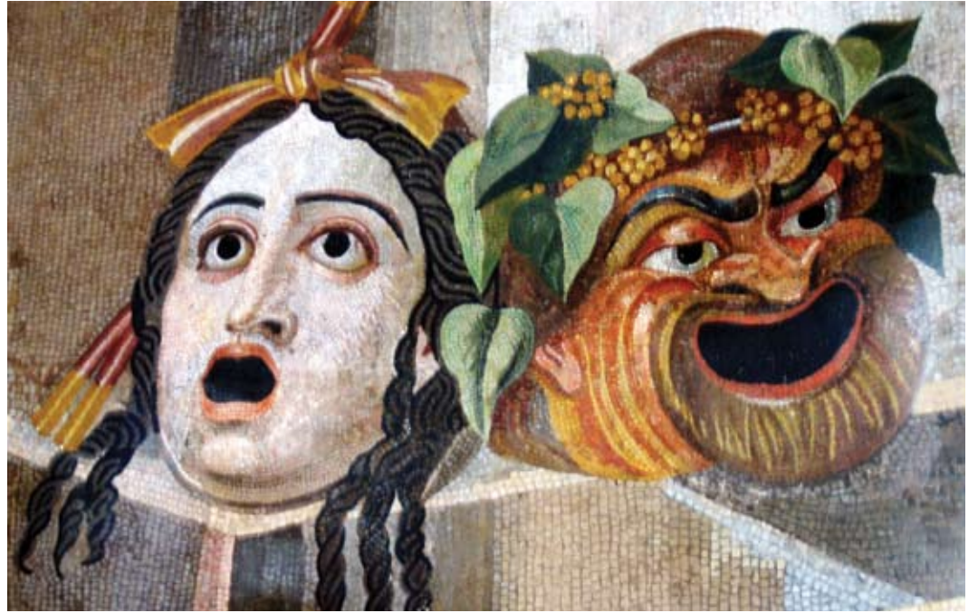
Teatro Universitário | Um espaço de divulgação de novos actores e dramaturgias

Oito peças, 22 espectáculos e cinco grupos. Em 2010, o Festival Internacional de Teatro de Tema Clássico (FESTEIA), organizado no âmbito da U-Coimbra (UC), volta a crescer. Depois de comemorados os dez anos de existência, a 12.ª edição, que decorre entre os dias 29 de Abril e 18 de Julho, afirma esta iniciativa da Associação Cultura Thíasos como uma das mais importantes no campo da divulgação da literatura greco-latina. Grupos universitários reúnem-se para reinterpretar peças que, escritas há mais de dois mil anos, continuam a surpreender e a fascinar pela sua extrema actualidade. Duas presenças espanholas, de Cádiz e Odón, juntam-se às três companhias portuguesas. A par da edição dos textos representados, o FESTEIA tem uma forte componente itinerante, percorrendo várias cidades do país. O espectáculo de abertura está a cargo do Grupo Thíasos do Instituto de Estudos Clássicos da UC, com Hipólito , de Eurípides,